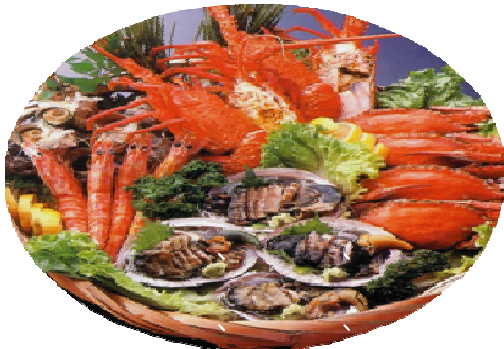
ひろはま荘名物 “てんぼな料理” (四人籠盛イメージ)

「てんぼな」とは志摩地方の方言で「素晴らしい」、「立派な」等の意味で、言葉通り、伊勢エビ、鮑、サザエ、旬の魚介類をふんだんに料理したものです。「てこね料理」は、古くから志摩町和具に伝わる旬の海鮮をつかった伝統の漁師料理で一度食べればとりこになる味です。